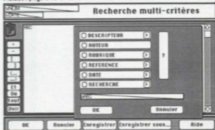
Pléiade : page d'écran de la recherche multicritère.

La société Infnit présentait le logiciel documentaire Thésaurus. Le logiciel propose des rubriques standards (numéro de fiche, date, titre, intitulé). Les rubriques paramétrables sont au nombre de douze (7 al-